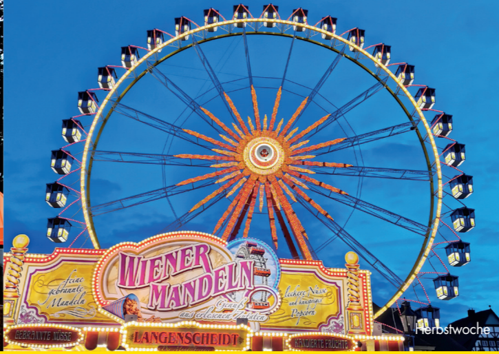
Starke Traditionen LIPPSTADT FEIERT FESTE