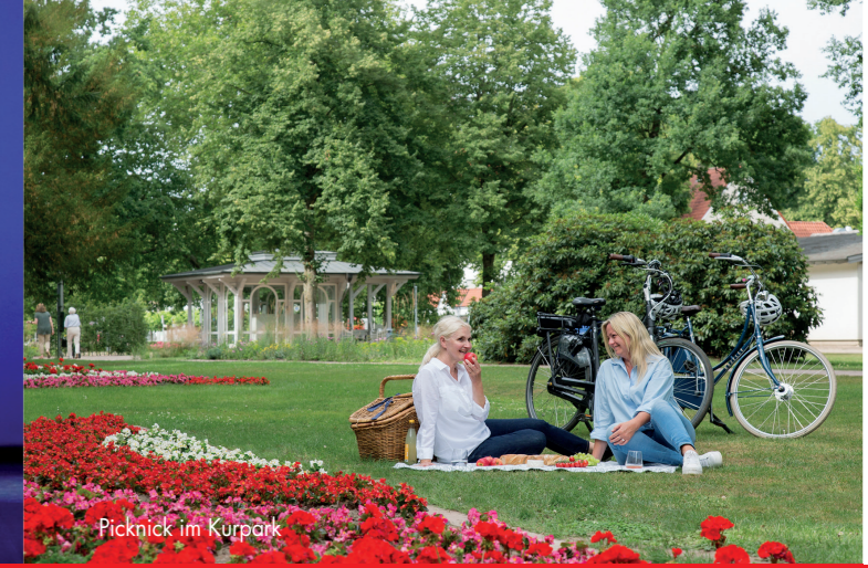
Hier geht's mir gut! BAD WALDLIESBORN

Vor über 835 Jahren durch Bernhard II. Edelherr zur Lippe gegründet, hat sich Lippstadt als älteste Gründungsstadt Westfalens von einer Ackerbürgerstadt zu einer blühenden Hanse- und Handelsstadt entwickelt. Heute ist Lippstadt die größte Stadt im Kreis Soest. Wandel auf den Spuren der Vergangenheit und entdecke den Charme und die lebendigen Facetten der liebenswerten Stadt an der Lippe. In der historischen Altstadt können sich Gäste auf eine spannende Zeitreise begeben. Dies ist beispielsweise bei einer Stadtführung zu Fuß, per Rad oder bei einer Kanutour möglich.