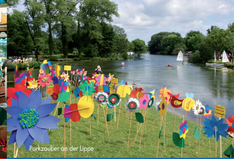
Erfrischend natürlich WASSERREICHES LIPPSTADT