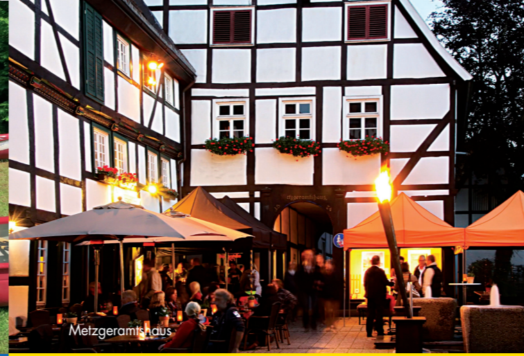
Wenn die Lichter angehen ABENDBUMMEL IN LIPPSTADT