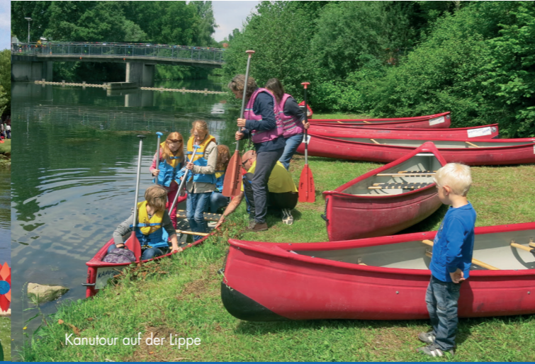
Immer in Bewegung LIPPSTADT AKTIV