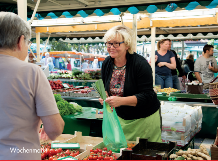
Schönheit kommt von innen DIE INNENSTADT